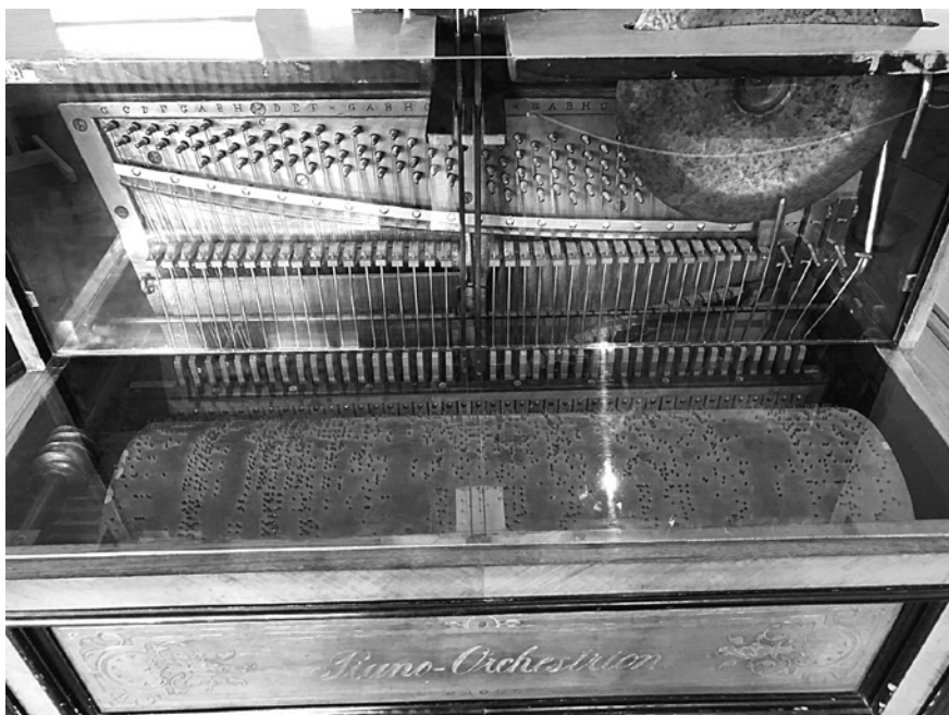
Abbildung 1: Piano-Orchestrion im Deutschen Museum

trions geht fließend über in den Beginn einer anderen Ära: die Erfindung der Tonaufzeichnung. Metheny erkennt in diesem Übergang eine » interesting middle zone «: Die erste Technik macht den Musiker überflüssig, die zweite konserviert die Qualitäten der musikalischen Interpretation.